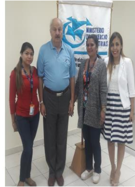
Fundamentos de Calidad y Excelencia, el 19 de mayo