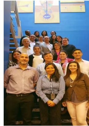
Taller Interpretación de la ISO/IEC 17021-1:2015, 9-11 de mayo en Buenos Aires – Argentina.