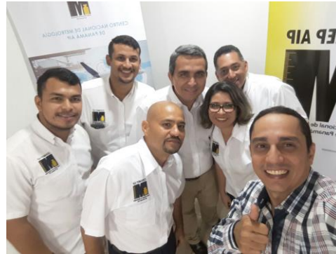
Foro "Mediciones para el Transporte" / Día Internacional de la Metrología. el 19 de mayo