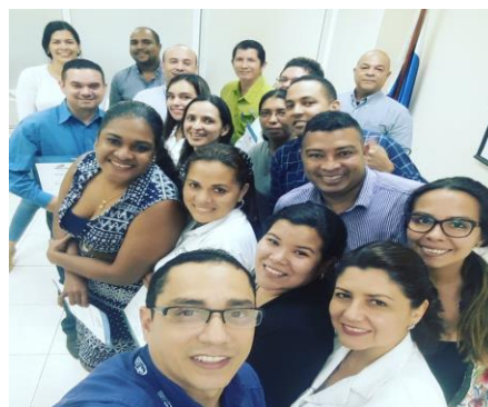
Interpretación de la Norma ISO 9001:2015, el 21 de julio.